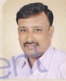
ಪಾಟೀಲ್ ಎಸ್ ಬಿ ಅಧಿಕಾರಿ