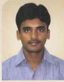
ಮಾರ್ಕಂಡೇಯ ಎ ಅಧಿಕಾರಿ