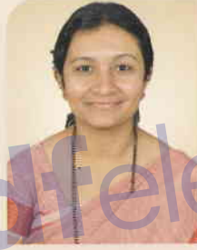
ಲತಾ ಗಣವಾರಿ ಅಧಿಕಾರಿ