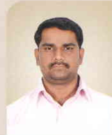
ಯಮನೂರ್ ಪಿ ಅಧಿಕಾರಿ