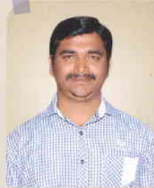
ಅಪ್ಪಾಜಿ ಸಜ್ಜನ್ ಅಧಿಕಾರಿ